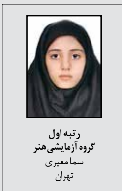
رتبه اول گروه آزمایشی هنر سما معیری تهران